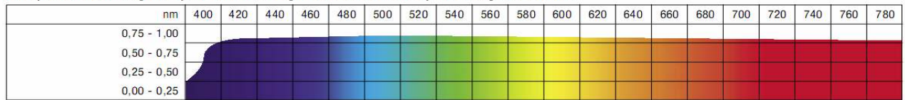
Farbspektrum Reflexionsgrad / Spectre lumineux Degré de réflexion / Colour spectrum Degree of reflection

Base material: PVC Colour: white, rear: black Flameproofed to: • German norm DIN 4102 B1 • French norm M1 • US norm NFPA 701 Width approx.: 83" Weight approx.: 17.14 oz/yd 2 Thickness approx.: 16 mil Roll length approx.: 164.0 yds Welding possibility (seaming): yes Application: front projection Screen type: D Opaque: yes Packing method: • Folded • Rolled on request